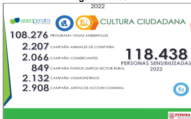
Figura No. 06

La Empresa de Aseo de Pereira tiene establecido un periodo desde el 2020 hasta el 2023, para sensibilizar al 72% de la población del municipio de Pereira, que para la vigencia 2022 fue de 485.373 habitantes y para lo cual se logró y rebasó la meta de 87.367, con 118.438 personas sensibilizadas en el 2022, dando un cumplimiento del 135.56%, a continuación, se evidencian los porcentajes por campaña.