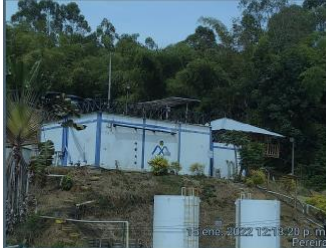
Figura No.01 Planta de tratamiento de lixiviado 2022