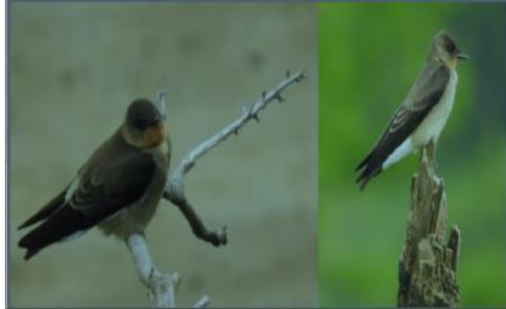
Figura No. 05 Golondrina gorgirrufa ( Stelgidopterx ruficollis )