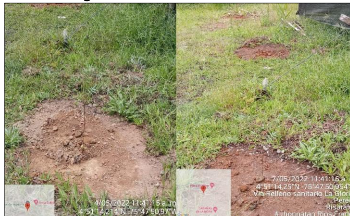
Figura No. 04. Arboles de Neem

De modo que, para la empresa es fundamental implementar medidas en el relleno sanitario con el fin de controlar la población de moscas es por esto que se ejecutan dos controles químico y biológico; en cuanto al control químico, este es desarrollado en diferentes instalaciones del relleno sanitario con una frecuencia mensual y en cuanto al control biológico se encuentra el ave de tamaño pequeño llamada golondrina gorgirrufa ( Stelgidopteryx ruficollis ), la cual se alimenta de las moscas domésticas presentes en el relleno. Además, se ejecutó la siembra de 21 árboles de Neem, como prueba piloto, este árbol tiene propiedades insecticidas y plaguicidas el cual es usado en ganaderías con tal fin como se muestra en las figuras 04 y 05.